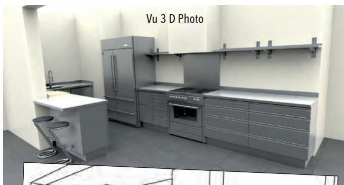
Vu 3 D Photo

En effet, nous proposons également un autre outil de professionnel : le billot. Juste à poser, sur piétement inox ou décliné en table, il existe en toute dimension, de 6 à 30 cm d'épaisseur, ou sur mesure. Ces pièces fort appréciées peuvent être encastrées dans le plan de travail et amovibles pour le nettoyage : la notion d'hygiène est toujours prise en considération quand on choisit l'inox !